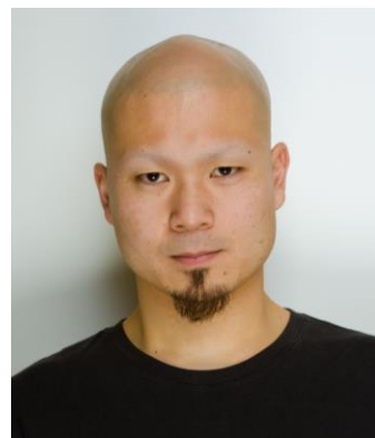
■講師 舞踏カンパニー