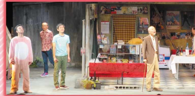
(H27:「大空の虹を見ると私の心は躍る」より)