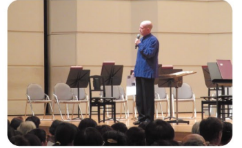
(H28:出演/井上道義(指揮)) 開場時に指揮者・ソリストなどが公演プログラムの解説を行う。