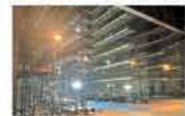
舞台に組まれた足場

プリズムホールの改修工事は現在、館内各所で更新する箇所(部屋やトイレ)の設備や壁材・床材の撤去が進められています。ホールの外側も、舞台も足場が高一く設置されました。