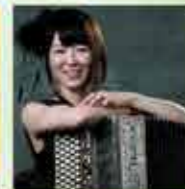
かとうかなこ (アコーディオン)