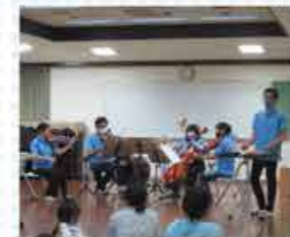
京フィルコンサート