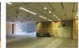
展示室は壁・床を撤去