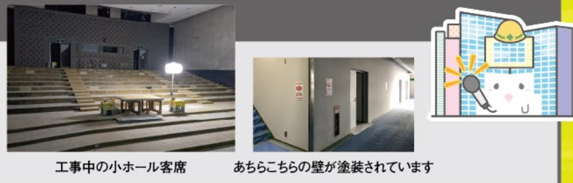
工事中の小ホール客席

館内はホールの天井が耐震性の高いものに入れ替えられたり、館内の壁の塗装などが行われています。大・小ホールの客席がない状態、ホールスタッフも見るのは最初で最後かもしれません！次回6月末に発行するPick up! Prismでは、大幅にリニューアルした場所を一部ご紹介予定です。お楽しみに♪