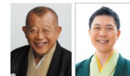
笑福亭鶴瓶 笑福亭笑助

チケット 全席指定(税込) 1階席 完売 2階席 一律2,500円(当日500円増)