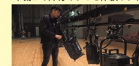
講師:プリズムホール舞台スタッフ

中学生以上で舞台スタッフの仕事が たっぷり体験したい方向け ステージテクニカルワークショップ(全2回) 舞台スタッフの一員として<バックステージ・ツアー>の準備から片付けまでを体験します!