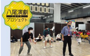
八尾演劇プロジェクト