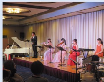
過去のコンサートの様子