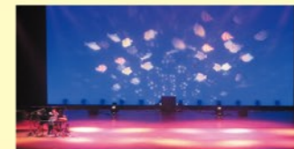
講師:プリズムホール舞台スタッフ

プリズムホールの舞台を探検だ! バックステージ・ツアー 舞台セット・照明・音響の操作も体験できる舞台裏ツアー