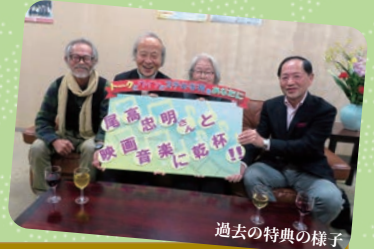
過去の特典の様子