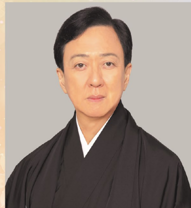
坂東玉三郎 お話と素踊り