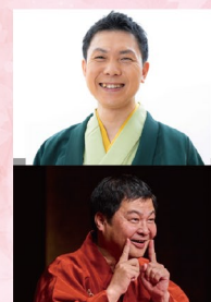
笑福亭笑助 プリズム独演会