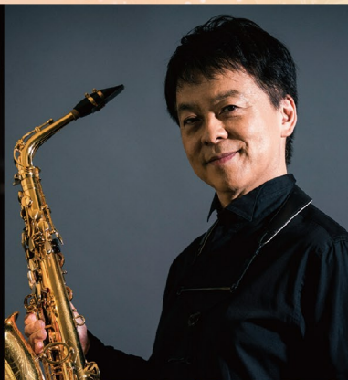
山下洋輔 × 須川展也スペシャルデュオ リサイタル