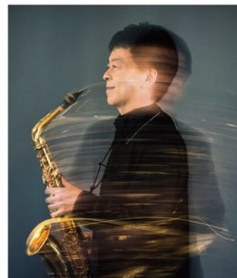
須川展也 (サクソフォン)

JAZZ界に衝撃を与え続け、80歳を超えてもなおチャレンジを続けるピアニスト・山下洋輔。クラシックサクソフォンの可能性を追求し、次世代の育成にも力を注ぐ須川展也。日本を代表するアーティストの貴重なデュオリサイタルがプリズムホールで実現します！長年の音楽ファンだけでなく若い世代にもぜひ聴いていただきたいリサイタルです。