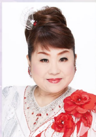
天童よしみコンサート