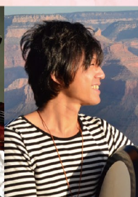
まちで魅了する舞台シリーズ × リズム@プリズム コラボレーション作品