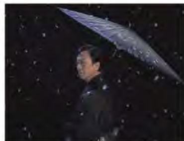
尼となった女性が昔の恋人を想う地唄舞「雪」

玉三郎さんといえばその美しさがあまりにも有名ですが、伎芸においてもずば抜けた存在で、人間国宝でもいらっやいます。お話では、ご自身で選んだ舞台映像や写真を紹介し、華やかな歌舞伎の世界をお話します。その美意識や芸への深い考え方は必聴です。素踊りは、「ほこりがたたないように舞う」といわれるほど繊細な地唄舞を風情たっぷりにみせる究極の芸の世界。玉三郎さん自らが演出をほどこして舞います。