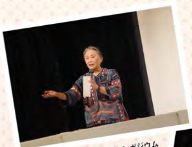
句会ライブ ※写真はイメージです。