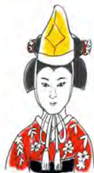
きょうがのこむすめどうしようし 『京鹿子娘道成寺』の花子

口跡、振り、姿と三拍子そろった名女形。驚異的な美しさと地芸に加え、現代的なセンスで数々の役を再構築してみせた。『桜姫東文章』の自由奔放な桜姫は、もはや伝説的だ。(吉野川)の定高のような立女形の大役はもちろん、『藤娘』では、まるで十代の少女が出現したかのような可愛らしさに客席がどよめいた。