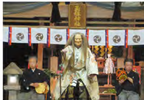
写真:能「山姥」(令和3年度高安薪能)