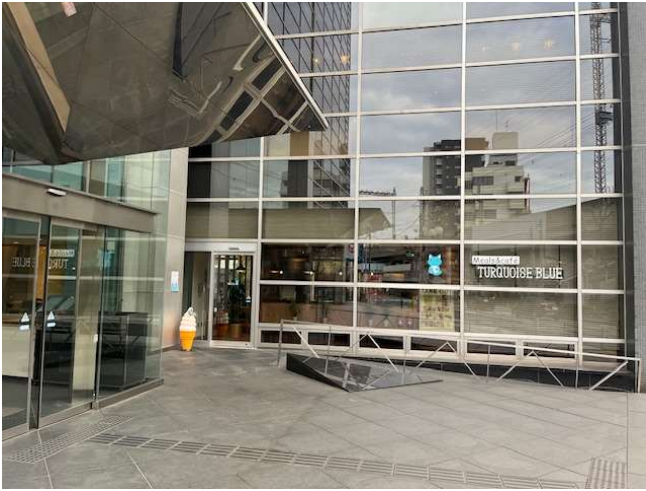
館外正面出入口より