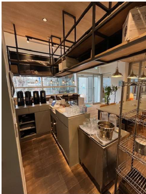
客室内カウンター(内側から)