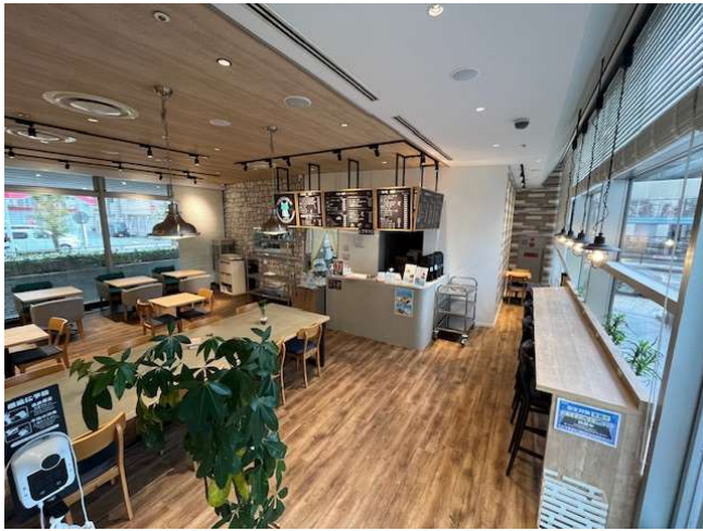
客室内(館内出入口より)