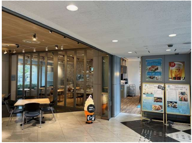
館内、光のプラザより