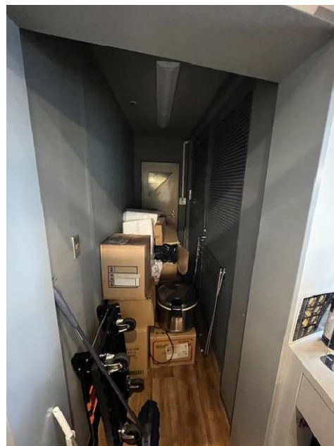
トイレ通路(空調機前、現在物置として活用)