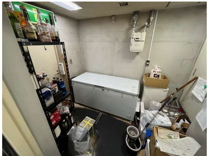
控室(厨房奥。外部への出入り)