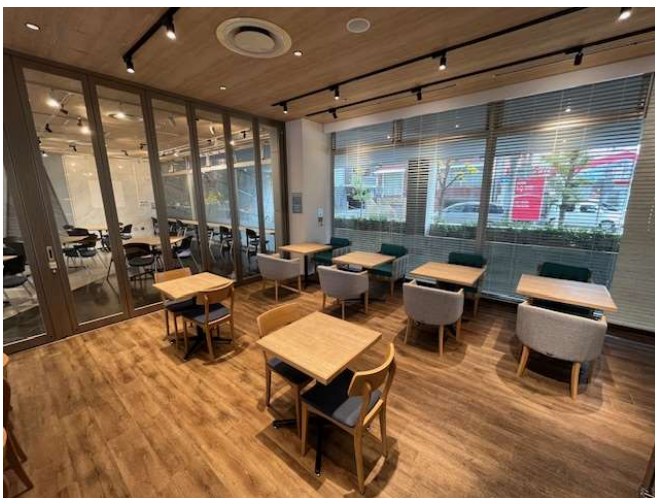
客室内(厨房付近より)